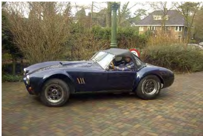
Voor het eerst op eigen kracht naar buiten.....

Aan de voorzijde staat hij nog omhoog. Ik moet er nog een andere radiator in Zetten. Die zou vrijdag 28e januari gereed staan voor me. Als je er zo langs kijkt met de deuren er in lijkt het al heel wat!