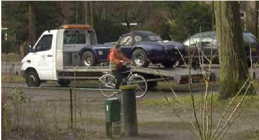
Op weg naar de RDW