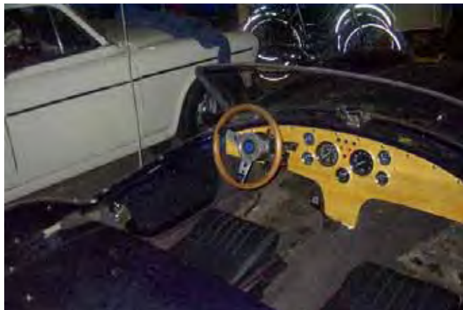
Het interieur in "douane-staat"

En floep, daar zitten de klokken en lampjes erin. De draden zitten er ook aan vast, en de meeste doen het zoals het hoort. Ook dingen die je niet zo direct ziet, ruitenwissers+sproeiers, ventilator en zo zijn onder controle. Alleen de intervalschakelaar wil nog niet. Lekker belangrijk op dit moment.