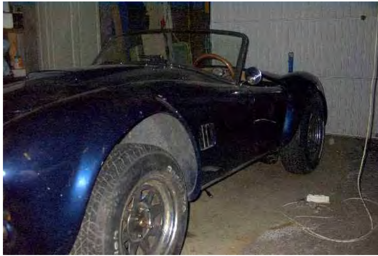
De deuren gemonteerd

Het hele spulletje zit er in. De auto moet nog ingevoerd worden, zodra ik bij de douane geweest ben (11 februari) ga ik verder met opknappen/afbouwen van het interieur.