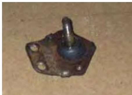
Fusee met te veel speling

Na wat papierwerk moest ik naar binnen komen bij de keuring. Het ging op 5 punten fout. Fuseekogel links onder, rechter voorrem bleef hangen, meer klemmetjes op remleidingen, borgplaatjes stuurstang vergeten om te slaan en er moeten grotere ringen onder de bouten van de stoelen. De defecte fuseekogel is hieronder te zien.