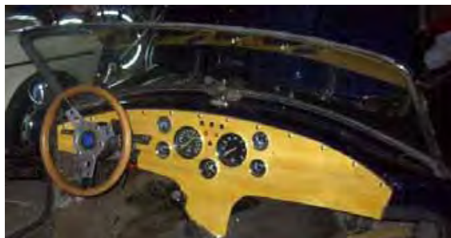
En nogmaals dashboard

Creativiteit met een decoupeerzagg levert een raamwerk voor het dashboard op zoals op de foto staat. Met de boutjes wordt het in de ronding van de koets getrokken.