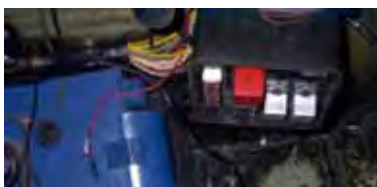
Zekeringen en relais

In de XR4i zaten de relais en zekeringen links onder de motorkap. Daar was geen ruimte in de Cobra. Onder het dashboard bij de bestuurder vond ik een plakje, de draden lijken lang genoeg