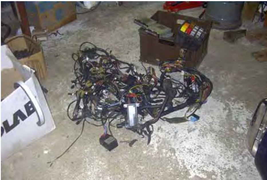
De kabelboom voor montage en snoeien

Het gat in de carrosserie was (natuurlijk) te groot voor wat ik er mee wilde. Het oorspronkelijke pookrubber van de sierra heb ik in de vouwen van de harmonica doorgeknipt en met een aluminium plaat op de cardantunnel vastgezet. De oorspronkelijke bekleding er maar even voor het gezicht overheen gevouwen. Dit vraagt nog wat "aandacht".