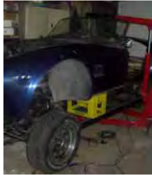
Koets binnen gelicht

Natuurlijk wilde ik alles eerst doen waar je nu eenvoudiger bij kon dan na het plaatsen van de koets. Je weet dat je vast iets vergeet, maar wat! Bij het plaatsen heb ik gebruik gemaakt van een motortakel en garagekrikjes, zo kon ik de koets beheerst laten zakken. Het was moeilijker om de koets te laten zakken dan voorheen omdat het blok e3r nu in lag. Bij het plaatsen bleek de koets niet meer zo ver naar voren wilde als bij het passen zonder dat het blok er in lag. Inderdaad, de uitlaat zat tegen de koets. Ook zat er een probleem bij het benzinefilter, dat bleek tegen de stuurstang te komen. Ik wilde de koets niet weer buiten op kratjes zetten en besloot om hem in de garage omhoog te heffen en dan de aanpassingen te maken. Aanpassingen maken is een andere term voor stukken uit de koets zagen en het filter verplaatsen.