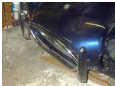
De voorbumper zit erop

Op de voorpagina zie je dat het stuur nog rechts zit, nu zit het links. De aansluiting met het stuurhuis is eveneens gemaakt. Ook de pedalen zitten er al in. Remolie heb ik er nog niet in gedaan, maar koppeling en gaskabel zijn wel aangesloten en passen.